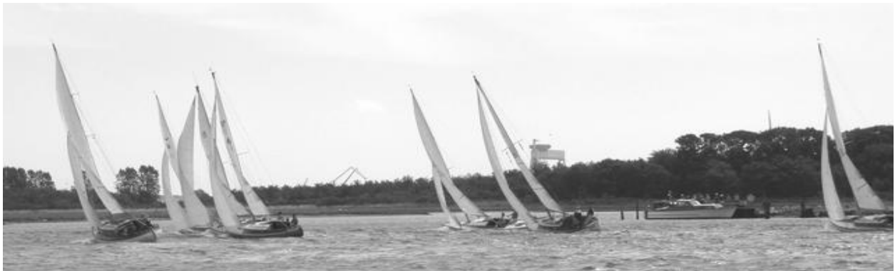
Kapsejlad under DEFÆL besøg i juli