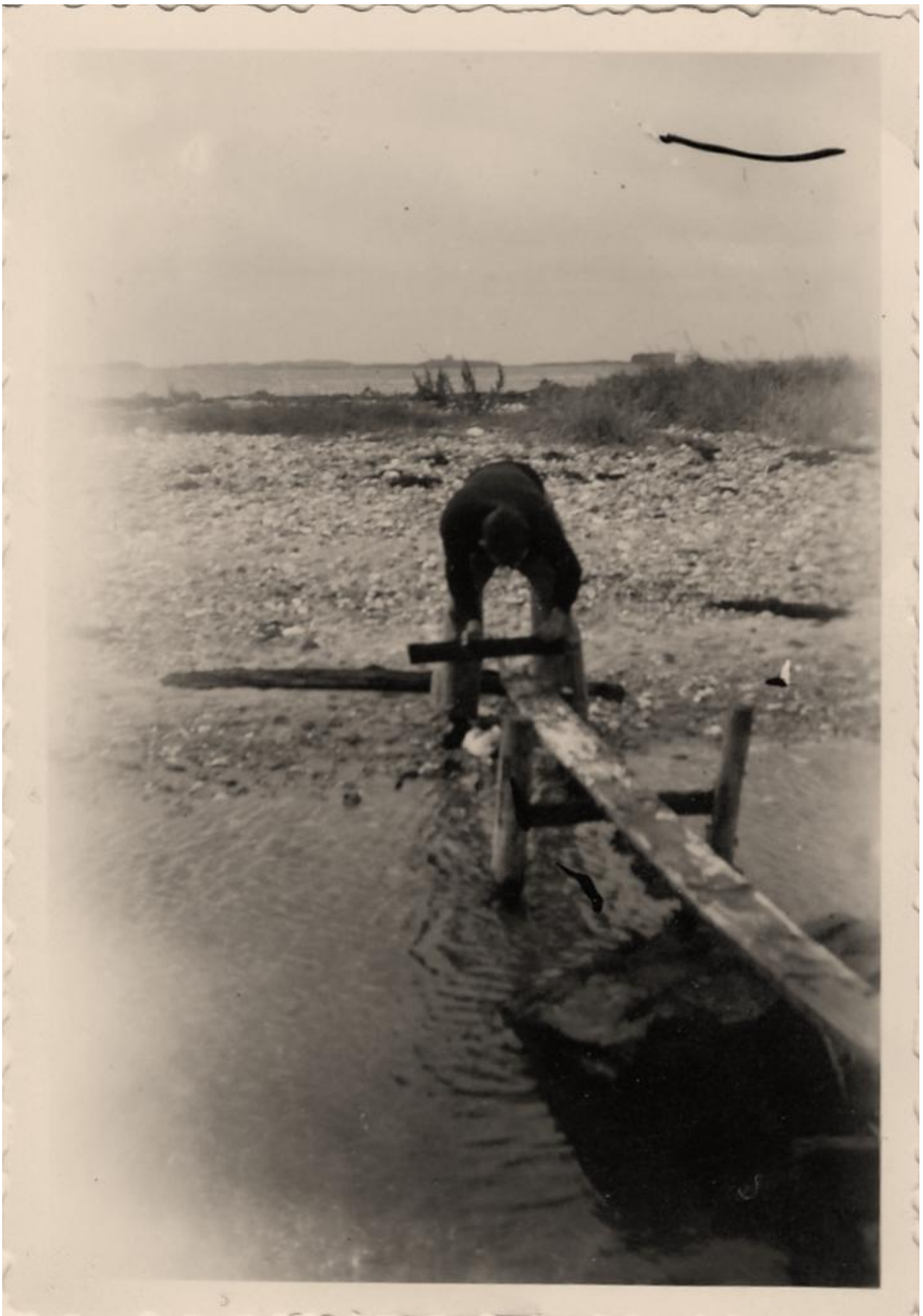
Der er nok ikke mange der kan huske det, men dette er den første bro i Korshavn, året er 1942.