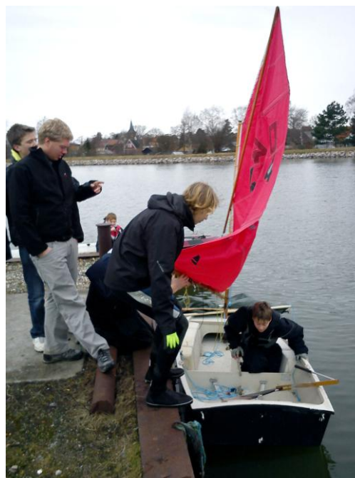
Sørøverjollen med spiler skulle prøves