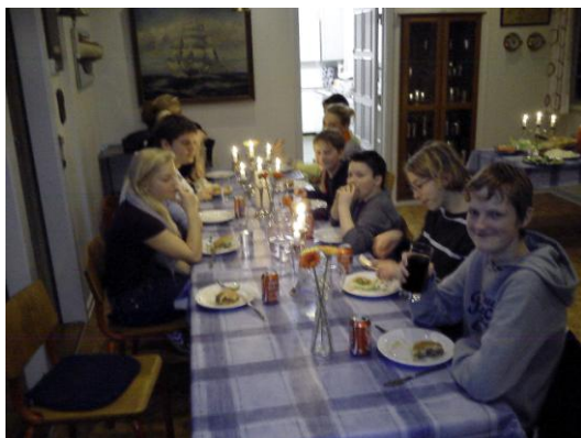
Hygge ved middagsbordet.