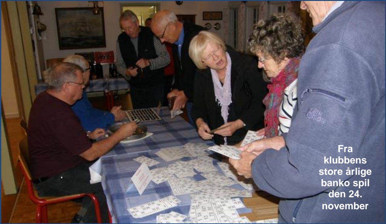
Fra klubbens store årlige banko spil den 24. november