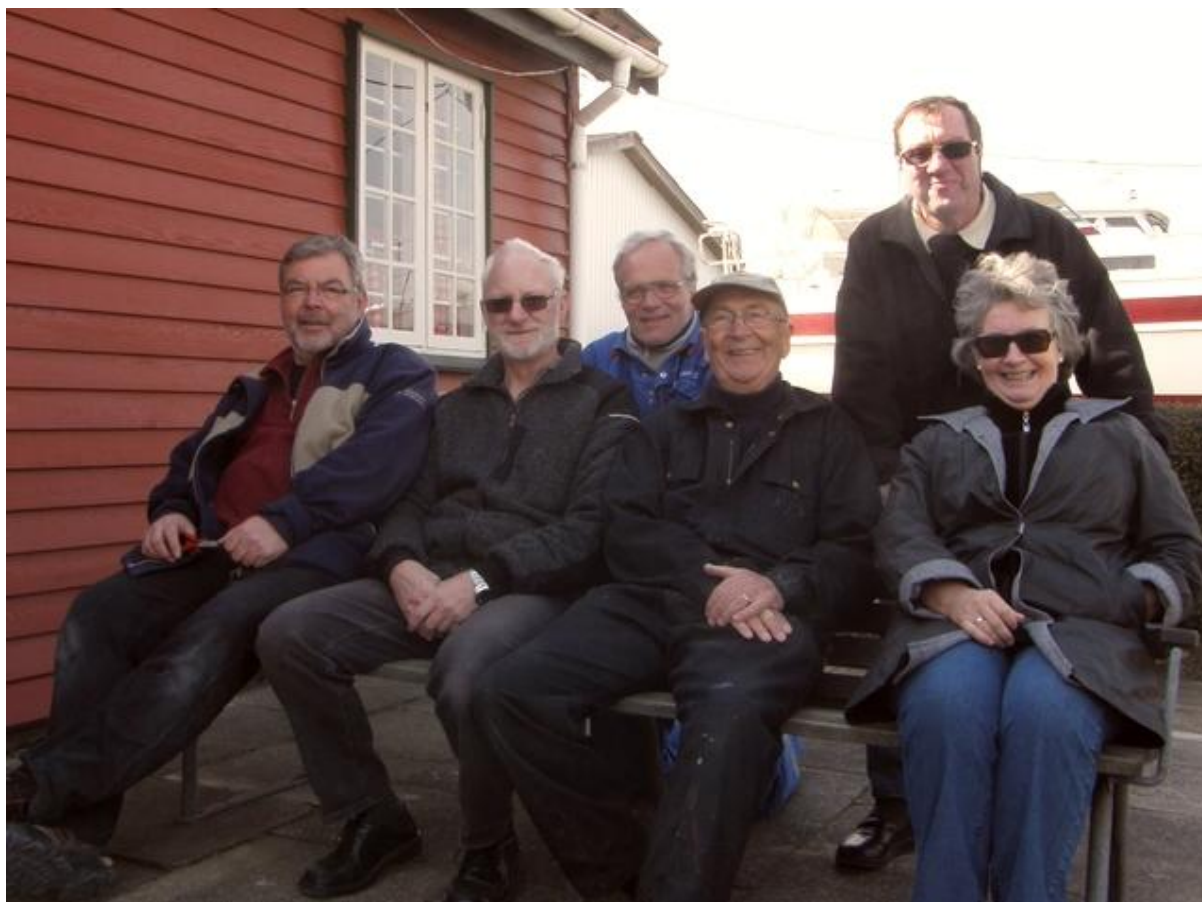
Billedet: Det var kun muligt at samle en lille del af det aktive C-hold til fotografering.