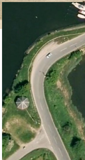
se: Kanalparti ved Stige.

Det er "oppe i tiden" at bringe "før og nu" billeder, så det prøver vi også her i årets sidste KLUBNYT. I disse internet tider, og med lidt Google søgning, er det rimelig let at finde nostalgien frem.