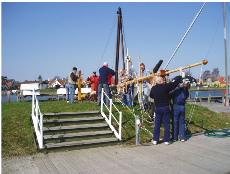
OS-medlemmer i gang med rejsning af den nye flagmast